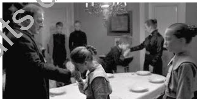
Aus dem Film von Haneke, das weiße Band .

Der Film " Das weiße Band " spielt im Jahre 1913 und thematisiert die strengen Erziehungsmethoden in einem Dorf in Norddeutschland. Mit diesem Film gewann Michael Haneke die goldene Palme in Cannes 2009.